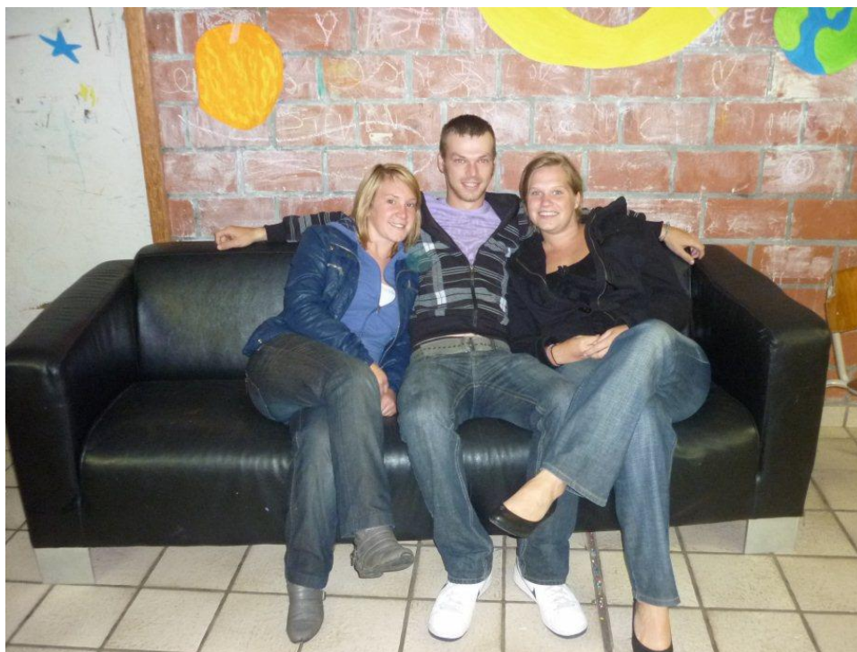
Sander staat niet op de foto

Keti zijn is best wel moeilijk, je bent wel al oud genoeg om te helpen maar nog te jong om alles al te mogen wat een Aspirant mag. Daarom zal hun leiding voor een geweldig jaar zorgen, zodat ze nooit meer Aspi willen worden!