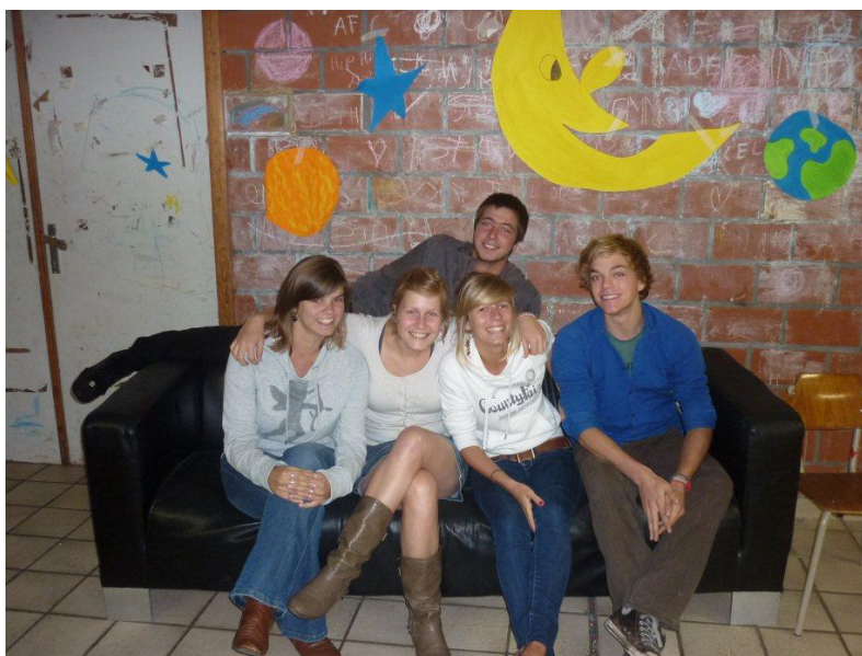
Katrien staat niet op de foto

Kadekes zijn de kleinsten maar misschien ook wel de fijnsten! Ze maken kennis met de Chiro en spelen spelletjes, trekken het bos in, maken hun lokaal super-gezellig,... Deze geweldige leiding staat hen vol spanning op te wachten!